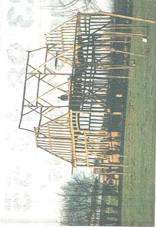
N 1986. Une grange démontée à Harcigny est remontée au lycée. Elle est aménagée en salle de réunion. Sur l'une des poutres figure l'inscription 1871. Tout un symbole.