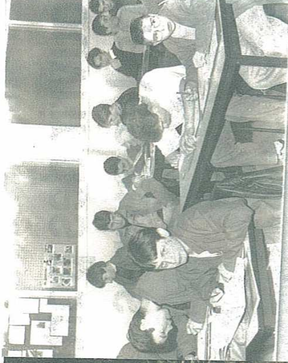
N CLASSE. Les apprenants rue Porte des champs avec la fameuse blouse bleue. Les élèves étaient déjà à l'étroit.