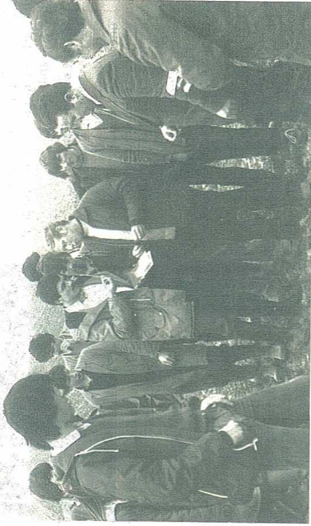
DANS LES CHAMPS. Les méthodes pédagogiques n'ont pas entièrement changé. Ici un cours dis « sur le tas », en plein champ.

Créé dans les années 60 sous un nom original, le lycée agricole, fleuron de la Thiérache, n'a cessé d'évoluer et de s'agrandir. Anciens élèves et professeurs retiennent une ambiance studieuse et familiale. Aujourd'hui, le lycée compte 260 élèves et 101 professeurs et agents.