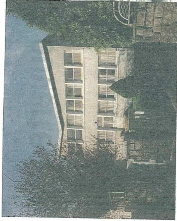
1963. Le lycée était initialement installé à Vervins, rue Porte des champs, le lycée s'appelait l'école d'agriculture d'hiver.