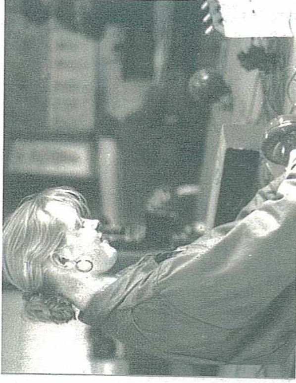
N LYCÉE QUI SE FÉMINISE. En combinaison bleue, les filles intègrent le lycée et prouvent qu'elles sont aussi capables que les garçons.